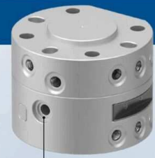
マニュアル操作ポート

※マニュアル操作ポート径につきましては、外形図(P.10~12)をご参照ください。